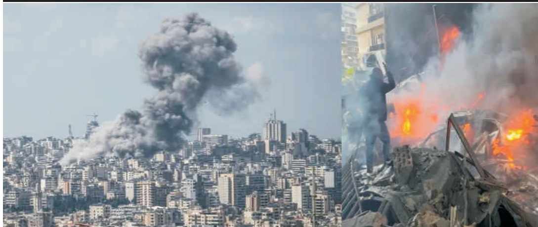
ਲੇਬਨਾਨ (ਪੰਜਾਬ ਸਟਾਰ ਬਿਊਰੋ): ਲੇਬਨਾਨ ਵਿੱਚ ਇਜ਼ਰਾਈਲੀ ਹਮਲਿਆਂ ਵਿੱਚ ਇੱਕ ਦਿਨ ਵਿੱਚ 254 ਲੋਕ ਮਾਰੇ ਗਏ ਹਨ, ਅਤੇ 1,165 ਤੋਂ ਵੱਧ ਜ਼ਖ਼ਮੀ ਹੋਏ ਹਨ। ਇਸ ਤੋਂ ਬਾਅਦ, ਦੇਸ਼ ਵਿੱਚ ਇੱਕ ਰਾਸ਼ਟਰੀ ਸੋਗ ਦਿਵਸ ਦਾ ਐਲਾਨ ਕੀਤਾ ਗਿਆ ਹੈ। ਲੇਬਨਾਨ ਦੇ ਪ੍ਰਧਾਨ ਮੰਤਰੀ ਨਵਾਫ਼ ਸਲਾਮ ਨੇ ਕਿਹਾ ਕਿ ਉਹ ਇਜ਼ਰਾਈਲੀ ਹਮਲਿਆਂ ਨੂੰ ਰੋਕਣ 'ਚ ਬਾਕੀ ਸ਼ਕਤੀ 2 'ਤੇ

ਰਾਸ਼ਟਰੀ ਸੋਗ ਦਾ ਕੀਤਾ ਐਲਾਨ ਇਰਾਨ ਨੇ ਕਿਹਾ ਕਿ ਜੰਗਬੰਦੀ ਅਤੇ ਯੁੱਧ ਇਕੱਠੇ ਨਹੀਂ ਚੱਲ ਸਕਦੇ