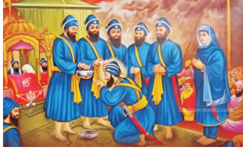
ਦੀ ਮੱਦਦ ਕਰਕੇ ਆਪਣੇ ਨਿਆਰੇਪਣ ਨੂੰ ਕਾਇਮ ਰੱਖਿਆ ਹੈ ਜਿਸ ਦੀ ਗੁੰਜ ਐਨ.ਓ. ਤੱਕ ਵੀ ਪਹੁੰਚੀ ਹੈ।

ਮੋਖ : ਨੌਕਰੀ ਅਤੇ ਕਾਰੋਬਾਰ: ਮਹੀਨੇ ਦੀ ਸ਼ੁਰੂਆਤ ਵਿੱਚ ਕੰਮ ਦਾ ਦਬਾਅ ਰਹੇਗਾ। 14 ਅਪ੍ਰੈਲ (ਵੈਸਾਖੀ) ਤੋਂ ਬਾਅਦ ਉੱਚ ਦਾ ਸੂਰਜ ਤੁਹਾਡੇ ਅਧਿਕਾਰਾਂ ਵਿੱਚ ਵਾਧਾ ਕਰੇਗਾ ਅਤੇ ਮਾਨ-ਸਨਮਾਨ ਦਿਵਾਏਗਾ।