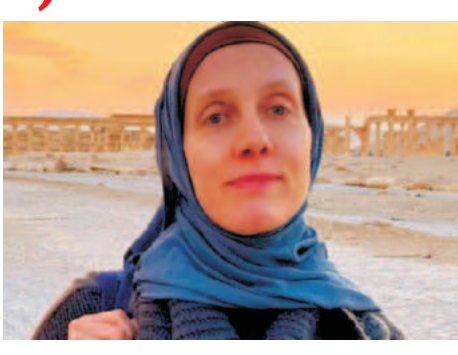
ਇਰਾਕੀ ਗ੍ਰਿਫ਼ਤਾਰ ਨੇ ਮੰਗਲਵਾਰ ਨੂੰ ਕਿਹਾ ਕਿ ਸੁਰੱਖਿਆ ਬਲਾਂ ਨੇ ਹਾਈਜੈਕਰਾਂ ਦੇ ਵਾਹਨ ਦਾ ਪਿੱਛਾ ਕੀਤਾ। ਇਸ ਦੌਰਾਨ ਅਗਵਾਕਾਰਾਂ ਦੀ ਕਾਰ ਪਲਟ ਗਈ, ਜਿਸ ਤੋਂ ਬਾਅਦ ਸੁਰੱਖਿਆ ਬਲਾਂ ਨੇ ਇਕ ਸ਼ੱਕੀ ਵਿਅਕਤੀ ਨੂੰ ਗ੍ਰਿਫ਼ਤਾਰ ਕਰ ਲਿਆ ਅਤੇ ਵਾਰਦਾਤ 'ਚ ਵਰਤੀ ਗਈ ਗੱਡੀ ਨੂੰ ਜ਼ਬਤ ਕਰ ਲਿਆ ਗਿਆ ਹੈ। ਮੰਤਰਾਲੇ ਨੇ ਇਕ ਬਿਆਨ ਜਾਰੀ ਕਰਕੇ ਕਿਹਾ, "ਪੱਤਰਕਾਰ ਦੀ ਸੁਰੱਖਿਅਤ