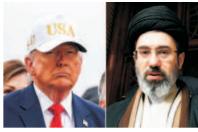
ਦੋਵਾਂ-ਵੱਡੇ ਦਾਅਵੇ ਕਰ ਰਹੇ ਹਨ। ਉਨ੍ਹਾਂ ਕਿਹਾ ਕਿ ਈਰਾਨ ਨੇ ਕਿਹਾ ਕਿ ਜੇਕਰ ਲੋੜ ਪਈ ਤਾਂ ਦੇਸ਼ 6 ਮਹੀਨਿਆਂ ਤੱਕ ਜੰਗ ਜਾਰੀ ਰਹਿ ਸਕਦਾ ਹੈ। ਜੰਗ ਲਈ ਈਰਾਨ ਪੂਰੀ ਤਰ੍ਹਾਂ ਤਿਆਰ ਹੈ।

ਮਹੀਨਾ ਪਾਰ ਕਰ ਗਈ ਇਸ ਜੰਗ ਵਿਚ ਈਰਾਨ ਨੇ ਅਮਰੀਕਾ ਨੂੰ ਵਿਚ ਤੋਂ ਵੱਡੀ ਧਮਕੀ ਦਿੱਤੀ ਹੈ। ਈਰਾਨ ਵੱਲੋਂ ਕਿਹਾ ਗਿਆ ਹੈ ਕਿ ਨਾ ਹੀ ਸਟ੍ਰੇਟ ਆਫ ਹਾਰਮੁਜ਼ ਖੱਲਿਆ ਜਾਵੇਗਾ ਤੇ ਨਾ ਹੀ ਕਿਸੇ ਕਿਸੇ ਦੀ ਗੱਲਬਾਤ ਹੋਵੇਗੀ। ਜੇਕਰ ਉਹ ਜ਼ਮੀਨੀ ਹਮਲਾ ਕਰਨ ਲਈ ਫੌਜ ਭੇਜਣ ਦੀ ਗਲਤੀ ਕਰਦਾ ਹੈ ਤਾਂ ਉਸ ਨੂੰ ਭਾਰੀ ਨੁਕਸਾਨ ਝੇਲਣਾ ਪਵੇਗਾ। ਵਿਦੇਸ਼ ਮੰਤਰੀ ਨੇ ਕਿਹਾ ਕਿ ਜੇਕਰ ਲੋੜ ਪਈ ਤਾਂ ਦੇਸ਼ 6 ਮਹੀਨਿਆਂ ਤੱਕ ਜੰਗ ਜਾਰੀ ਰਹਿ ਸਕਦਾ ਹੈ। ਜੰਗ ਲਈ ਈਰਾਨ ਪੂਰੀ ਤਰ੍ਹਾਂ ਤਿਆਰ ਹੈ।