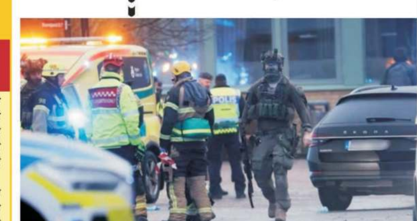
(ਪੰਜਾਬ ਸਟਾਰ ਬਿਊਰੋ) ਸਥਾਨਕ ਅਖ਼ਬਾਰ ਸਵੀਡਿਸ਼ ਹੋਰਾਲਡ ਮੁਤਾਬਕ ਸਵੀਡਨ ਦੇ ਸਕੂਲ ਵਿੱਚ ਮੰਗਲਵਾਰ ਨੂੰ ਹੋਈ ਗੋਲੀਬਾਰੀ ਵਿੱਚ 10 ਲੋਕਾਂ ਦੀ ਮੌਤ ਹੋ ਗਈ। ਹਮਲੇ ਵਿੱਚ ਵਿਅਕਤੀ ਗੰਭੀਰ ਰੂਪ 'ਚ ਜ਼ਖ਼ਮੀ ਹੈ।

ਗੋਲੀਬਾਰੀ ਰਾਜਧਾਨੀ ਸਟਾਕਹੋਮ ਤੋਂ 200 ਕਿਲੋਮੀਟਰ ਪੱਛਮ ਵਿੱਚ ਓਰੋਬਰੋ ਸ਼ਹਿਰ ਦੇ ਇੱਕ ਵਿਅਕਤੀ ਗੰਭੀਰ ਰੂਪ 'ਚ ਜ਼ਖ਼ਮੀ ਹੈ। ਰਿਸ਼ਬਰਗਸਕਾ ਸਕੂਲ 'ਬਾਕੀ ਸਫਾ 2' ਤੇ