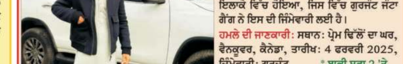
(ਪੰਜਾਬ ਸਟਾਰ ਬਿਊਰੋ) ਕੈਨੇਡਾ ਵਿੱਚ ਪੰਜਾਬੀ ਗਾਇਕ ਪ੍ਰੇਮ ਢਿੱਲੋਂ ਦੇ ਘਰ ਦੇ ਬਾਹਰ ਗੋਲੀਬਾਰੀ ਦੀ ਘਟਨਾ ਸਾਹਮਣੇ ਆਈ ਹੈ। ਇਹ ਹਮਲਾ 4 ਫਰਵਰੀ 2025 ਨੂੰ ਵੈਨਕੂਵਰ ਦੇ ਇਲਾਕੇ ਵਿੱਚ ਹੋਇਆ, ਜਿਸ ਵਿੱਚ ਗੁਰਜੱਟ ਜੱਟਾ ਗੈਂਗ ਨੇ ਇਸ ਦੀ ਜ਼ਿੰਮੇਵਾਰੀ ਲਈ ਹੈ।

ਹਮਲੇ ਦੀ ਜਾਣਕਾਰੀ: ਸਥਾਨ: ਪ੍ਰੇਮ ਢਿੱਲੋਂ ਦਾ ਘਰ, ਵੈਨਕੂਵਰ, ਕੈਨੇਡਾ, ਤਾਰੀਖ: 4 ਫਰਵਰੀ 2025, ਜ਼ਿੰਮੇਵਾਰੀ: ਗੁਰਜੱਟ 'ਬਾਕੀ ਸਫਾ 2' ਤੇ