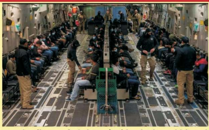
ਕਪੂਰਥਲਾ ਦੇ 6, ਅੰਮ੍ਰਿਤਸਰ 5, ਜਲੰਧਰ ਤੇ ਪਟਿਆਲਾ ਦੇ 4-4 ਤੇ ਗੁਜਰਾਤ ਪੂਰ ਦੇ 2 ਲੋਕ ਸ਼ਾਮਲ ਹਨ। ਪੰਜਾਬ ਪੁਲਿਸ ਨੇ ਅਪਰਾਧਿਕ ਪਿਛੋਕੜ ਵਾਲੇ ਕਰੀਬ 100 ਲੋਕਾਂ ਦੇ ਅਪਰਾਧੀਆਂ ਦੀ ਸੂਚੀ ਤਿਆਰ ਕੀਤੀ ਹੈ, ਜਿਨ੍ਹਾਂ ਵਿੱਚੋਂ 20 ਜਣਿਆਂ ਦੇ ਅਮਰੀਕਾ ਵਿੱਚ ਲੁਕੇ ਹੋਣ ਦਾ ਸ਼ਕਾਸ਼ ਹੈ। ਪੰਜਾਬ ਪੁਲਿਸ ਨੇ ਇਹ ਦਾਅਵਾ ਅਜਿਹੇ ਮੌਕੇ ਕੀਤਾ ਹੈ, ਜਦੋਂ ਗੈਰਕਾਨੂੰਨੀ ਭਾਰਤੀ ਪ੍ਰਵਾਸੀਆਂ ਨੂੰ ਲੈ ਕੇ ਅਮਰੀਕੀ ਫੌਜੀ ਮਾਲਵਾਕ ਜਹਾਜ਼ ਭਾਰਤ ਪਹੁੰਚਿਆ ਹੈ। ਪੰਜਾਬ ਪੁਲਿਸ ਕੋਲ ਹਾਲਾਂਕਿ ਵਾਪਸ ਭਾਰਤ ਭੇਜੇ ਗਏ

(ਪੰਜਾਬ ਸਟਾਰ ਬਿਊਰੋ) ਅੰਮ੍ਰਿਤਸਰ: ਅਮਰੀਕਾ ਦੇ ਨਵੇਂ ਰਾਸ਼ਟਰਪਤੀ ਡੋਨਾਲਡ ਟਰੰਪ ਦੀ ਗੈਰ-ਕਾਨੂੰਨੀ ਪ੍ਰਵਾਸੀਆਂ ਮਿਲਾਫ਼ ਸਖ਼ਤ ਸਮੁੱਚੇ ਦੇਸ਼ ਨਿਕਾਲੇ ਦੀ ਮੁਹਿੰਮ ਤਹਿਤ ਇਕ ਅਮਰੀਕੀ ਫੌਜੀ ਸੀ-17 ਜਹਾਜ਼ 205 ਗੈਰ-ਕਾਨੂੰਨੀ ਪ੍ਰਵਾਸੀ ਭਾਰਤੀਆਂ ਨੂੰ ਲੈ ਕੇ ਅੰਮ੍ਰਿਤਸਰ ਕੌਮਾਂਤਰੀ ਹਵਾਈ ਅੱਡੇ 'ਤੇ ਪਹੁੰਚ ਚੁੱਕਿਆ ਹੈ। ਸੂਤਰਾਂ ਮੁਤਾਬਕ ਇਨ੍ਹਾਂ ਵਿੱਚੋਂ ਕੁਮਿਨਲ ਰਿਕਾਰਡ ਵਾਲੇ ਲੋਕਾਂ ਨੂੰ ਏਅਰਪੋਰਟ 'ਤੇ ਹੀ ਗ੍ਰਿਫ਼ਤਾਰ ਕੀਤਾ ਜਾ ਸਕਦਾ ਹੈ। ਪਹਿਲਾਂ ਇਹ ਜਹਾਜ਼ ਦਿੱਲੀ ਅੰਤਰਰਾਸ਼ਟਰੀ ਹਵਾਈ ਅੱਡੇ 'ਤੇ ਉਤਰਨਾ ਸੀ। ਵਾਪਸ ਲਿਆਂਦੇ ਗਏ 205 ਭਾਰਤੀਆਂ ਵਿੱਚੋਂ 104 ਦੀ ਲਿਸਟ ਸਾਹਮਣੇ ਆਈ ਹੈ, ਜਿਨ੍ਹਾਂ ਵਿੱਚੋਂ 30 ਪੰਜਾਬ ਤੋਂ ਹਨ, 2 ਚੰਡੀਗੜ੍ਹ ਤੋਂ, ਜਦਕਿ 33 ਹਰਿਆਣਾ ਦੇ ਰਹਿਣ ਵਾਲੇ ਹਨ। ਇਸ ਤੋਂ ਇਲਾਵਾ 33 ਗੁਜਰਾਤ ਤੋਂ, 3 ਉੱਤਰ ਪ੍ਰਦੇਸ਼ ਅਤੇ 3 ਮਹਾਰਾਸ਼ਟਰ ਤੋਂ ਹਨ। ਸੂਤਰਾਂ ਮੁਤਾਬਕ ਇਨ੍ਹਾਂ ਵਿੱਚ 13 ਨਾਬਾਲਗ ਵੀ ਸ਼ਾਮਲ ਹਨ, ਜੋ ਗੈਰ-ਕਾਨੂੰਨੀ ਢੰਗ ਨਾਲ ਅਮਰੀਕਾ ਗਏ ਸਨ। ਪੰਜਾਬ ਨਾਲ ਸਬੰਧਤ ਹਨ, ਜਿਨ੍ਹਾਂ 'ਚ 4 ਲੋਕ ਜਲੰਧਰ ਨਾਲ ਸਬੰਧਤ ਦੱਸੇ ਜਾ ਰਹੇ ਹਨ। ਇਸ ਦੇ ਨਾਲ ਹੀ ਭੁਲਾਬ, ਕਪੂਰਥਲਾ, ਪਟਿਆਲਾ, ਅੰਮ੍ਰਿਤਸਰ, ਜਗਰਾਓਂ ਤੇ ਹੋਰ ਇਲਾਕਿਆਂ ਦੇ ਲੋਕ ਵੀ ਜਹਾਜ਼ ਵਿੱਚ ਸ਼ਾਮਲ ਹਨ। ਇਨ੍ਹਾਂ ਵਿੱਚ ਤਿੰਨ ਕੁੜੀਆਂ ਵੀ ਸ਼ਾਮਲ ਹਨ। ਇਹ ਤਿੰਨੋਂ ਅੰਮ੍ਰਿਤਸਰ, ਜਗਰਾਓਂ ਅਤੇ ਭੁਲਾਬ ਨਾਲ ਸਬੰਧਤ ਹਨ। ਖ਼ਾਸ ਗੱਲ ਇਹ ਹੈ ਕਿ ਇਨ੍ਹਾਂ ਤਿੰਨਾਂ ਦੀ ਉਮਰ ਹੀ 30 ਸਾਲ ਤੋਂ ਘੱਟ ਹੈ। ਭੁਲਾਬ ਦਾ ਹੀ 10 ਸਾਲ ਦਾ ਬੱਚਾ ਵੀ ਸ਼ਾਮਲ ਹੈ। ਇਸ ਦੇ ਨਾਲ ਹੀ