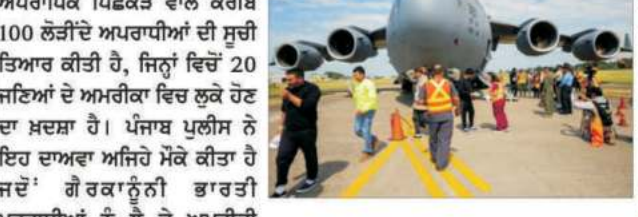
ਚੰਡੀਗੜ੍ਹ: ਪੰਜਾਬ ਪੁਲੀਸ ਨੇ ਅਪਰਾਧਿਕ ਪਿਛੋਕੜ ਵਾਲੇ ਕਰੀਬ 100 ਲੋੜੀਂਦੇ ਅਪਰਾਧੀਆਂ ਦੀ ਸੂਚੀ ਤਿਆਰ ਕੀਤੀ ਹੈ, ਜਿਨ੍ਹਾਂ ਵਿੱਚੋਂ 20 ਜਣਿਆਂ ਦੇ ਅਮਰੀਕਾ ਵਿੱਚ ਲੁਕੇ ਹੋਏ ਦਾ ਸ਼ਕਾਬ ਹੈ। ਪੰਜਾਬ ਪੁਲੀਸ ਨੇ ਇਹ ਦਾਅਵਾ ਅਜਿਹੇ ਮੌਕੇ ਕੀਤਾ ਹੈ ਜਦੋਂ ਗੈਰਕਾਨੂੰਨੀ ਭਾਰਤੀ ਪਰਵਾਸੀਆਂ ਨੂੰ ਲੈ ਕੇ ਅਮਰੀਕੀ

100 ਅਪਰਾਧੀਆਂ ਦੀ ਕੇਸ ਹਿਸਟਰੀ ਤਿਆਰ; 20 ਅਪਰਾਧੀ ਅਮਰੀਕਾ 'ਚ ਸਰਗਰਮ