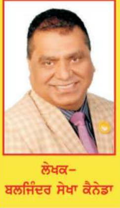
ਲੇਖਕ- ਬਲਜਿੰਦਰ ਸੇਖਾ ਕੋਨੇਡਾ

ਅਨੁਭਵ ਕਰਦੇ ਹਨ। ਉਦਾਹਰਨ ਲਈ, ਕਿਸੇ ਮਾਨਸਿਕ ਬਿਮਾਰੀ ਵਾਲੇ ਵਿਅਕਤੀ ਦੇ ਪਰਿਵਾਰਕ ਮੈਂਬਰਾਂ ਨੂੰ ਵੀ ਕਲੀਨਿਕ ਕੀਤਾ ਜਾ ਸਕਦਾ ਹੈ, ਸਿਰਫ ਸੰਗਤ ਦੁਆਰਾ।