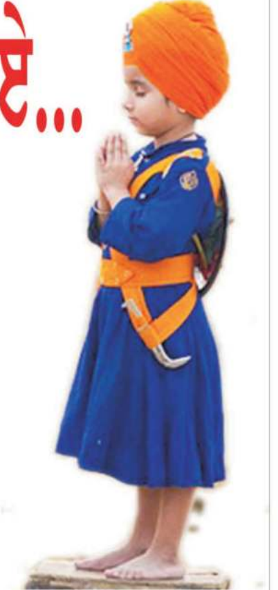
ਪਰ ਆਦਿ ਆਸ ਦਾ ਪੱਲਾ ਨਾ ਛੱਡੀਏ ਜੀਏ ਆਸਾ ਮੇਰੇ ਨਿਰਾਸ਼ਾ ਗੁਰਾਂ ਦੇ ਨਾਂ ਹੇਠ ਵਸਦੇ ਪੰਜਾਬ ਦੇ ਲਈ ਨਵੇਂ ਸਾਲ ਨਵੇਂ ਸਵੇਰ ਨਵੇਂ ਸੂਰਜ ਨੂੰ ਮੁੱਖ ਰੱਖ ਕੇ ਅਰਦਾਸਾਂ ਅਰਜ਼ੀਆਂ ਕਰੀਏ ਤੇ ਗੁਰਾਂ ਦੇ ਨਾਂ ਹੇਠ ਵਸਦਾ ਪੰਜਾਬ ਇਸੇ ਤਰ੍ਹਾਂ ਵੱਸਦਾ ਰਹੇ ਪੰਜਾਬ ਪੰਜਾਬੀ ਪੰਜਾਬੀਅਤ ਜਿੰਦਾਬਾਦ ਰਹੇ।

ਅੱਜ ਪੰਜਾਬੀ, ਉਹ ਪੰਜਾਬ ਦੀ ਧਰਤੀ ਮਾਂ ਦੇ ਲਾਚਾਰ ਬੇਵਸ ਮਾਯੂਸ ਹਨ ਬਾਬੇ ਨਾਨਕ ਵੱਲੋਂ ਚਲਾਇਆ ਗਿਆ ਅੰਡਰਾ ਤੇ ਨਿਵੇਕਲਾ ਸਿੱਖੀ ਦਾ ਮਾਰਗ ਉਹ ਵੀ ਡਾਵਾਂਡਲ ਹੋ ਜੇ ਰਾਜਨੀਤਿਕ ਆਗੂਆਂ ਨੇ ਪੰਜਾਬ ਦੇ ਨਾਲ ਗੱਦਾਰੀ ਕੀਤੀ ਹੈ ਤਾਂ ਧਰਮੀ ਆਗੂਆਂ ਸ਼ਖਸੀਅਤਾਂ ਅਖੇਤੀ ਸੰਤ ਬਾਬਿਆਂ ਆਪੂ ਬਣੇ ਬ੍ਰਹਮ ਗਿਆਨੀ ਨੇ ਵੀ ਧਾਰਮਿਕ ਪੱਖੋਂ ਪੰਜਾਬ ਨਾਲ ਘੱਟ ਨਾ ਕੀਤੀ। ਧਰਮ ਦੇ ਨਾਂ ਹੇਠ ਲੋਕਾਂ ਨੂੰ ਦੋਹੀ ਹੱਥੀ ਕੁੱਟਿਆ ਲੁੱਟਿਆ ਜਾ ਰਿਹਾ ਹੈ। ਧਰਮ ਦੇ ਨਾਂ ਹੇਠ ਭਗਤੀ ਲਈ ਬਣੇ ਭੋਰਿਆਂ ਵਿੱਚ ਗੱਲ ਤਾਂ ਚੱਢੀ ਗਿਆਨ ਦੀ ਹੋ ਰਹੀ ਹੈ ਪਰ ਹੋ ਉੱਚੇ ਬਲਾਤਕਾਰ ਰਹੇ ਹਨ ਤੋੜਾ ਤੋੜਾ ਗੱਲ ਕਰਦਿਆਂ ਨੂੰ ਵੀ ਸ਼ਰਮ ਆਉਂਦੀ ਹੈ।