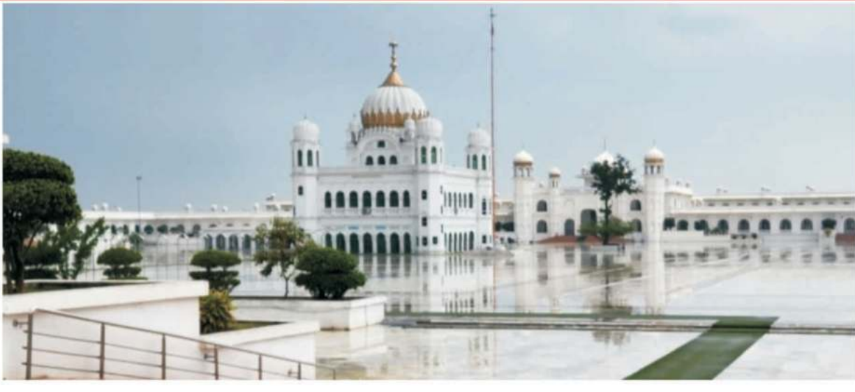
ਪੁਸਤਕਾਂ ਲਿਜਾਣ ਤੋਂ ਮਨੁੱਖ ਕਰ ਦਿੱਤਾ। ਤੁਸੀਂ ਪੁਸਤਕਾਂ ਜਾਂ ਕੋਈ ਵੀ ਲਿਟਰੇਚਰ ਨਾਲ ਨਹੀਂ ਲਿਜਾ ਸਕਦੇ। ਭਾਰਤੀ ਕਰਮੀ ਤੋਂ ਇਲਾਵਾ ਹੋਰ ਕੋਈ ਕਰਮੀ ਨਾਲ ਨਹੀਂ ਲਿਜਾ ਸਕਦੇ।