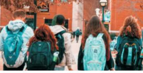
ਰਿਪੋਰਟ ਅਨੁਸਾਰ, ਕੈਨੇਡਾ ਵਿੱਚ 3,19,130 ਭਾਰਤੀ ਵਿਦਿਆਰਥੀ ਸਨ। ਇਹ ਦੋ ਕਾਲਜਾਂ ਅਤੇ ਯੂਨੀਵਰਸਿਟੀਆਂ ਵਿੱਚ ਭਾਰਤੀ ਵਿਦਿਆਰਥੀ ਸਭ ਤੋਂ ਵੱਧ ਹਨ। ਮਿਲਰ ਨੇ ਕਿਹਾ, "ਇੱਥੇ ਆਉਣ ਵਾਲੇ ਕਿਸੇ ਵੀ ਵਿਦਿਆਰਥੀ ਨੂੰ ਪੜ੍ਹਾਈ ਕਰਨ ਲਈ ਆਉਣਾ ਚਾਹੀਦਾ ਹੈ। ਵਿਦਿਆਰਥੀਆਂ ਨੂੰ ਹਫ਼ਤੇ ਵਿੱਚ 24 ਘੰਟੇ ਕੰਮ ਕਰਨ ਦੀ ਇਜਾਜ਼ਤ ਦੇਣ ਦਾ ਮਤਲਬ ਹੈ ਕਿ ਉਹ

ਟੋਰਾਂਟੋ : ਕੈਨੇਡਾ ਸਰਕਾਰ ਨੇ ਭਾਰਤ ਸਮੇਤ ਹੋਰ ਦੇਸ਼ਾਂ ਤੋਂ ਆਉਣ ਵਾਲੇ ਅੰਤਰਰਾਸ਼ਟਰੀ ਵਿਦਿਆਰਥੀਆਂ ਲਈ ਨਵੇਂ ਨਿਯਮ ਬਣਾਏ ਹਨ। ਇਸ ਨਿਯਮ ਦੇ ਤਹਿਤ, ਅੰਤਰਰਾਸ਼ਟਰੀ ਵਿਦਿਆਰਥੀ ਹੁਣ ਹਫ਼ਤੇ ਵਿੱਚ ਸਿਰਫ਼ 24 ਘੰਟੇ ਕੈਂਪਸ ਤੋਂ ਬਾਹਰ ਕੰਮ ਕਰ ਸਕਣਗੇ। ਇਹ ਨਿਯਮ ਸਤੰਬਰ ਤੋਂ ਲਾਗੂ ਹੋ ਗਿਆ ਹੈ, ਜਿਸ ਕਾਰਨ ਭਾਰਤੀ ਵਿਦਿਆਰਥੀਆਂ ਨੂੰ ਟੋਰਾਂਟੋ ਵਰਗੇ ਮਹਿੰਗੇ ਸ਼ਹਿਰਾਂ 'ਚ ਰਹਿਣ-ਸਹਿਣ ਦਾ ਖਰਚਾ ਚੁੱਕਣਾ ਬਹੁਤ ਹੀ ਮੁਸ਼ਕਲ ਹੋ ਜਾਵੇਗਾ। ਪਹਿਲਾਂ ਅੰਤਰਰਾਸ਼ਟਰੀ ਵਿਦਿਆਰਥੀਆਂ ਨੂੰ 20 ਘੰਟਿਆਂ ਤੋਂ ਵੱਧ ਸਮੇਂ ਲਈ ਕੈਂਪਸ ਤੋਂ ਬਾਹਰ ਕੰਮ ਕਰਨ ਦੀ ਇਜਾਜ਼ਤ ਦਿੱਤੀ ਜਾਂਦੀ ਸੀ। ਹੁਣ ਕੈਨੇਡਾ ਸਰਕਾਰ ਦੇ ਇਮੀਗ੍ਰੇਸ਼ਨ ਮੰਤਰੀ ਮਾਰਕ ਮਿਲਰ ਨੇ ਕਿਹਾ ਕਿ ਵਿਦਿਆਰਥੀਆਂ ਨੂੰ ਹਫ਼ਤੇ ਵਿੱਚ 20 ਘੰਟੇ ਤੋਂ ਵੱਧ ਸਮੇਂ ਲਈ ਕੈਂਪਸ ਤੋਂ ਬਾਹਰ ਕੰਮ ਕਰਨ ਦੀ ਇਜਾਜ਼ਤ ਦੇਣ ਵਾਲੀ ਅਸਥਾਈ ਨੀਤੀ ਦੀ ਮਿਆਦ 30 ਅਪ੍ਰੈਲ ਨੂੰ ਖਤਮ ਹੋ ਗਈ ਹੈ। ਹਾਲਾਂਕਿ, ਇਸ ਨੂੰ ਅੱਗੇ ਨਹੀਂ ਵਧਾਇਆ ਜਾਵੇਗਾ। "ਉਨ੍ਹਾਂ ਅੱਗੇ ਕਿਹਾ, "ਸਾਡਾ ਉਦੇਸ਼ ਅੰਤਰਰਾਸ਼ਟਰੀ ਵਿਦਿਆਰਥੀਆਂ ਲਈ ਪ੍ਰਤੀ ਹਫ਼ਤੇ ਕੰਮ ਦੇ ਘੰਟੇ ਘਟਾਉਣਾ ਹੈ, ਤਾਂ ਜੋ ਉਹ ਆਪਣੀ ਪੜ੍ਹਾਈ 'ਤੇ ਵੀ ਧਿਆਨ ਦੇ ਸਕਣ, ਅੰਤਰਰਾਸ਼ਟਰੀ ਵਿਦਿਆਰਥੀ ਕੈਨੇਡਾ ਵਿੱਚ ਹਫ਼ਤੇ ਵਿੱਚ ਸਿਰਫ਼ 24 ਘੰਟੇ ਕੰਮ ਕਰ ਸਕਣਗੇ। ਕੈਵਿਡ-19 ਦੀ ਮਹਾਮਾਰੀ ਦੇ ਦੌਰਾਨ 20 ਘੰਟੇ ਦੀ ਸੀਮਾ ਹਟਾਈ ਗਈ ਸੀ। ਪ੍ਰਧਾਨ ਮੰਤਰੀ ਜਸਟਿਨ ਟਰੂਡੋ ਦੀ ਲਿਬਰਲ ਪਾਰਟੀ ਦੀ ਸਰਕਾਰ ਨੇ ਦੇਸ਼ ਦੀ ਕੈਵਿਡ-19 ਮਹਾਮਾਰੀ ਦੇ ਦੌਰਾਨ ਅੰਤਰਰਾਸ਼ਟਰੀ ਵਿਦਿਆਰਥੀਆਂ ਲਈ ਕੰਮ ਦੇ ਘੰਟਿਆਂ ਦੀ 20 ਘੰਟਿਆਂ ਦੀ ਸੀਮਾ ਨੂੰ ਹਟਾ ਦਿੱਤਾ ਹੈ। ਕੈਨੇਡਾ ਭਾਰਤੀ ਵਿਦਿਆਰਥੀਆਂ ਲਈ ਸਭ ਤੋਂ ਪਸੰਦੀਦਾ ਸਥਾਨਾਂ ਵਿੱਚੋਂ ਇੱਕ ਹੈ। ਕੈਨੇਡੀਅਨ ਬਿਊਰੋ ਫਾਰ ਇੰਟਰਨੈਸ਼ਨਲ ਐਜੂਕੇਸ਼ਨ ਦੀ 2022 ਦੀ