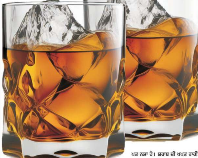
ਪਤ ਨਸ਼ਾ ਹੈ। ਸ਼ਰਾਬ ਦੀ ਖਪਤ ਰਾਹੀਂ